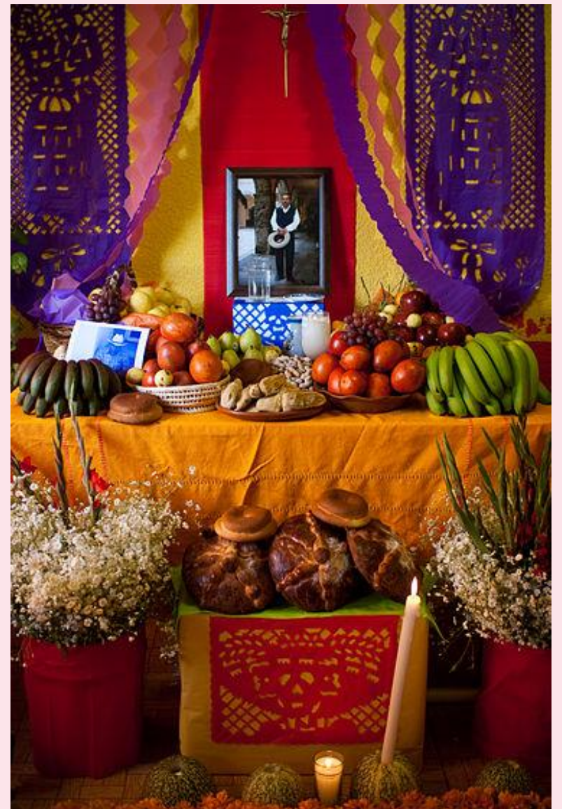
Βωμός της Ημέρας των Νεκρών