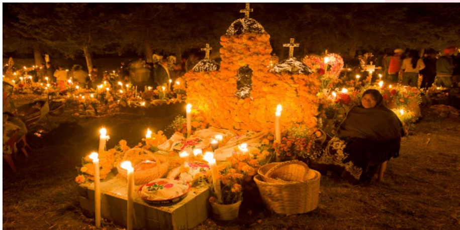
Τάφος νεκρού την ημέρα των νεκρών